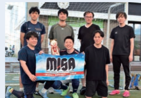
コンピューターマネージメント(株)