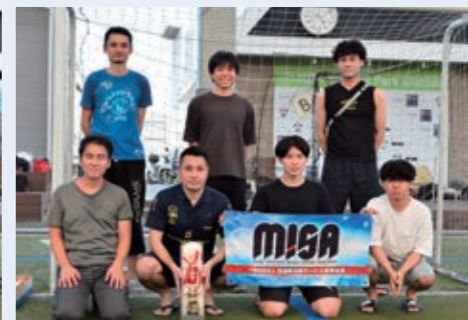
SCSK Minoriソリューションズ(株)