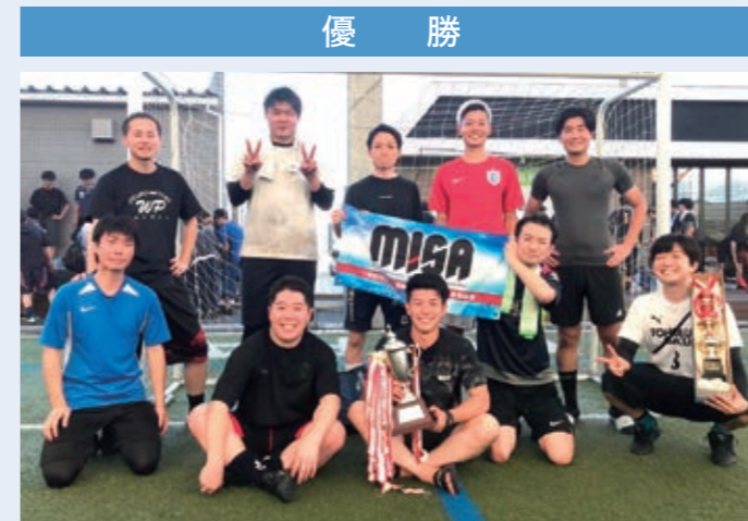
(株)テレコムリサーチ