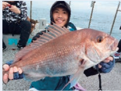
真鯛72センチ！ お見事！

天候にも恵まれ非常に釣り日和となりました。合計で真鯛5枚、ワラサ3本、花鯛1枚、アジ数本、ホーボー数本、カナガシラ数本、サバ無限（笑）という釣果でした。